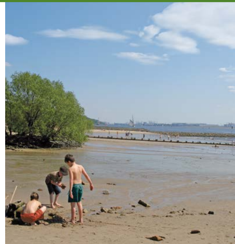
Herrliche Momente am Elbstrand