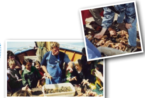
Kutterfahrt „Gret Palucca“ ab List