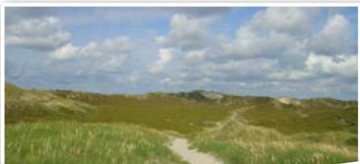
Der Weg zur See

Auf dem 7ha großen Heimgelände stehen ein Fußballplatz, Tischtennisplatten, Minigolf, Kletterwand, Spielgeräte und ein reservierter Strandabschnitt (durch die DLRG bewacht) zur Verfügung.