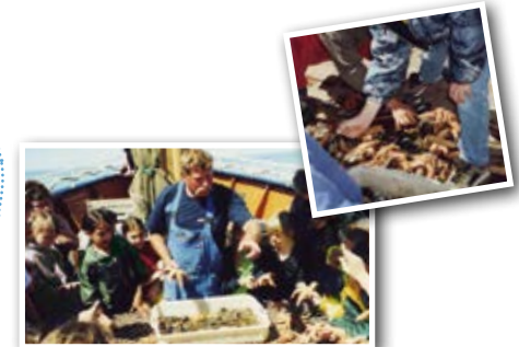
Kutterfahrt „Gret Palucca“ ab List