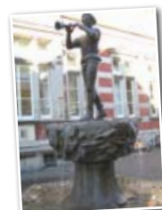
Stadtführung in Hameln