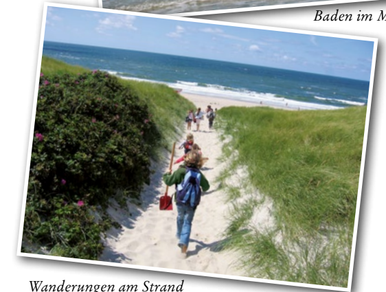
Wanderungen am Strand