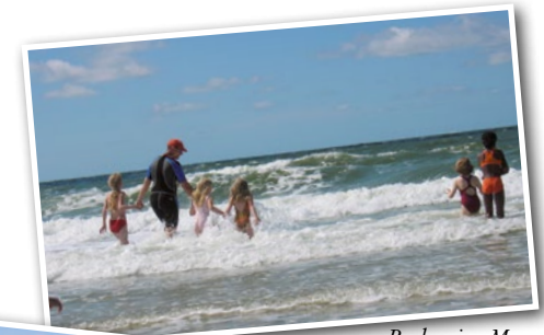
Baden im Meer