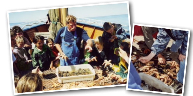
Kutterfahrt „Gret Palucca“ ab List