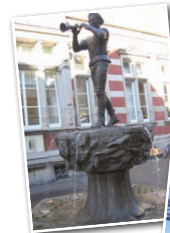
Stadtführung in Hameln