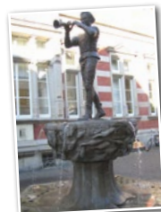
Stadtführung in Hameln